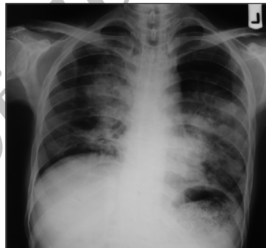
شکل ۳- گرافی ریه بیمار با درگیری دوطرفه