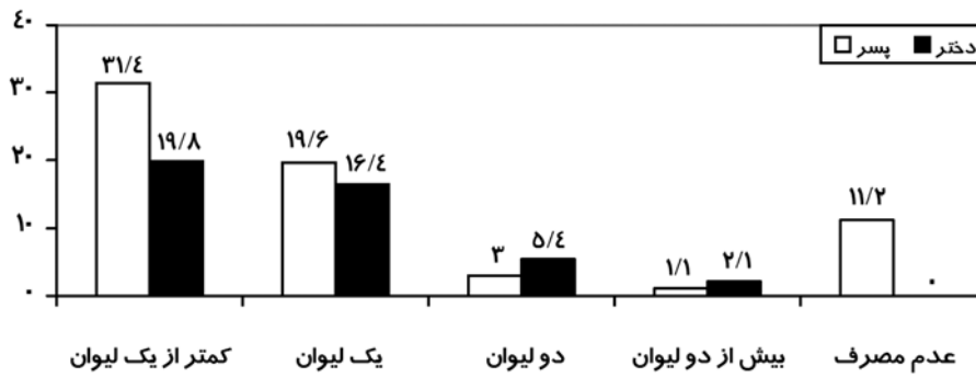
نمودار ۲- مقایسه میزان مصرف ماست روزانه در دختر و پسر ( P=۰/۰۰۱ )