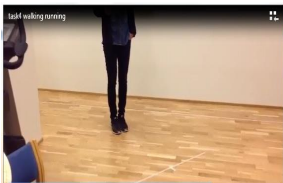
شکل ۳- آیتم راه رفتن با پاشنه پا

۳- راه رفتن با پاشنه پا ۲ : شرکت کننده باید روی یک خط مستقیم به طول ۴/۵ متر که روی سطح علامت‌گذاری شده به بیشترین سرعتی که بتواند پاشنه پای خود را در مقابل پنجه پا در هر قدم بگذارد، به سمت جلو حرکت می‌کند (شکل ۳)، سپس زمان صرف شده برای انجام آیتم از لحظه شروع تا پایان خط به عنوان امتیاز فرد ثبت می‌شود.