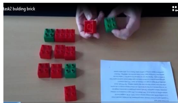
شکل ۲- آیتم چیدمان آجر

۲- چیدمان آجر ۱ : دوازده آجر به شکل مربع دویلو برای ساختن یک برج به سریع‌ترین شکل ممکن استفاده می‌شوند. شرکت کننده یک آجر در یک دستش و یک آجر در دست دیگرش نگه می‌دارد. با علامت شروع، شرکت کننده آجرها را یکی پس از دیگری روی هم می‌گذارد تا دوازده آجر به شکل برج روی هم سوار شوند (شکل ۲). آزمون فقط یک‌بار انجام می‌شود و زمان انجام تست از لحظه شروع تا پایان ثبت می‌شود.