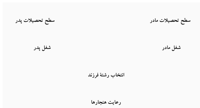
شکل ۲ - رابطه سطح تحصیلات و شغل پدر و مادر و انتخاب رشته تحصیلی

معنی داری نشان داد، برای روشن تر شدن موضوع، نگاه کنید به شکل ۲.