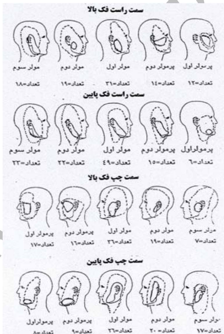
شکل ۲: الگوهای ارجاع درد دندانهای ماگزیلا و مندیبل طرف راست و چپ به نواحی خارج دهان، خطوط پیوسته نواحی شایعتر ارجاع درد و خطوط نقطه چین نواحی ارجاع درد با شیوع کمتر می‌باشد.

ناشی از بیست دندان خلفی فک بالا و پایین به طور جداگانه بررسی شد حجم وسیعی از آنالیز داده‌ها وجود داشت که سعی گردید جهت فهم و مقایسه بهتر، آسانتر و سریعتر، کل اطلاعات در قالب جداول ۱ و ۲ ارائه شود. در این جداول توزیع فراوانی و درصد ارجاع درد در نواحی مختلف سرو گردن، به ترتیب از شایعترین محل ارجاع تا کمترین محل ارجاع تنظیم شده است، به عنوان مثال محل ارجاع درد دندانهای خلفی