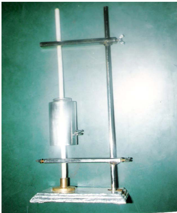
شکل ۱: دستگاه ویژه آزمون سیلان

جهت انجام آزمون باید دستگاه ویژه آزمون سیلان طراحی می شد که شامل اجزای زیر می باشد. یک وزنه فلزی، یک محوری با رسانایی گرمایی پایین و یک صفحه برنجی گرد. وزن کل این سه قسمت در هوا دو کیلوگرم و حداقل فاصله قاعده پایین وزنه فلزی از سطح صفحه برنجی ۷۶ میلی متر می باشد. محور از جنس پلاستیک سخت یا ماده ای مشابه آن با رسانایی کم بوده تا از اتلاف حرارت نمونه ها جلوگیری کند، قطر صفحه برنجی نباید از پنجاه میلی متر کمتر باشد و ضخامت آن هم حداکثر می تواند ۶/۳۵ میلی متر باشد. (شکل ۱)