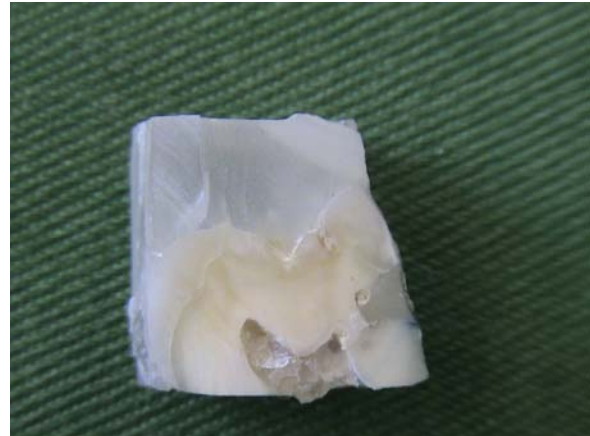
شکل ۱: عدم نفوذ رنگ در مارجین اکلوزال و نفوذ به سمان در دیواره حفره در مارجین جینجیوال

Irie در سال ۲۰۰۱ میزان درز (Gap) را در اینله هایی که به وسیله چهار نوع سمان (Compolute, Permacem, Fuji plus, Panavia 21) سمان شده بودند بررسی کرد. وی میزان درزی به اندازه ده میکرون را برای نمونه های Panavia 21 گزارش کرد که این درز پس از چرخه حرارتی به طور معنی داری افزایش می یافت. میزان درز در مورد Fuji plus و Permacem، ۶۰-۱۱۰ میکرون بود که این مقدار پس از چرخه حرارتی کاهش می یافت (۲). در مطالعه دیگری در سال ۲۰۰۳ که توسط Haller انجام شد تطابق لبه ای