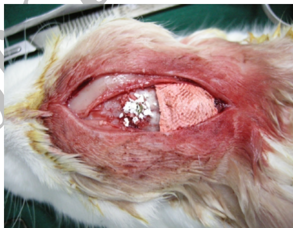
شکل ۱: قرار دادن بایواوس اطراف پیچ قدامی و پوشاندن نرات ADDM توسط غشای گوتا

فراوان شسته شدند و از قسمت وسط و عمود بر سطح به دو نیم تقسیم گردیدند. لازم به ذکر است که این خط برش الزاماً می‌بایست از محل قرار دادن پیچ می‌گذشت. قطعات حاصل از این برش در مقطع خود نشان‌دهنده کل ضخامت استخوان‌سازی (ضخامت استخوان آهیانه خرگوش به همراه ضخامت استخوان تازه تشکیل شده اطراف پیچ) بود. از هر کدام از قطعات مذکور دو مقطع بافتی با ضخامت پنج میکرون تهیه شده، به روش H&E رنگ آمیزی گردید. مقاطع رنگ آمیزی شده در زیر میکروسکوپ نوری ZEISS و با درشت نمایی 40\times مورد بررسی قرار گرفتند تا ضخامت استخوان تازه ایجاد شده در آن برحسب میلی-متر به دست آید.