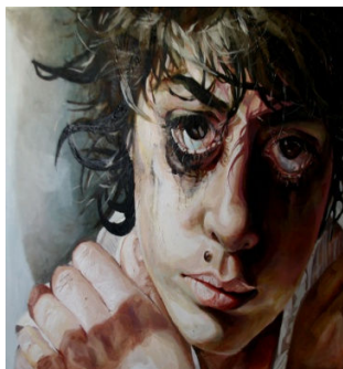
اثری از محبوبه بیات خردمند