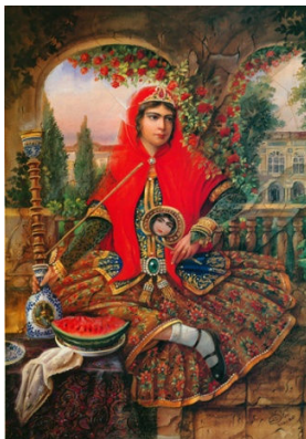
اثری از حجت‌اله شکيبا