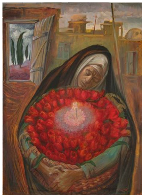
اثری از کاظم چلیپا