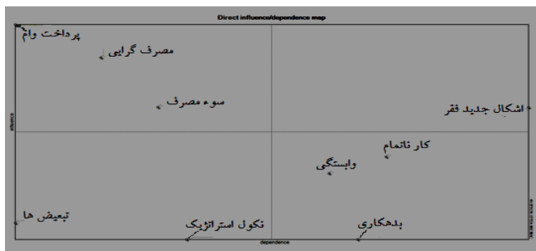
شکل ۳. نمودار تأثیرگذاری و تأثیرپذیری مستقیم تأثیرات منفی اقتصادی استراتژی مرسوم توانمندسازی

دووجهی یا تقویت کننده فقط شامل متغیر «شکل گیری اشکال جدید فقر و محرومیت» است. در بخش جنوب شرقی شکل ۳، متغیرهای ظهور وابستگی جدید، بدهکاری و ظهور کسب کارهای ناتمام فراوان به دلیل اندک بودن اعتبارات قرار گرفته اند و در بخش جنوب غربی متغیرهای قابل چشم پوشی قرار دارند که شامل گرایش های فریبکارانه ناشی از نکول استراتژیک (عدم بازپرداخت وام ها) و افزایش تبعیض های درون جنسیتی و بین جنسیتی است. نتایج ذکر شده در شکل ۳ نشان داده شده است.