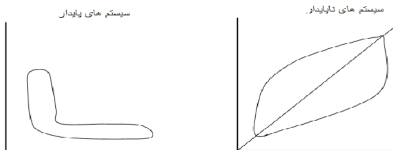
شکل ۵. سیستم پایدار و ناپایدار

در نمودارهای تأثیرگذاری و تأثیرپذیری مستقیم تأثیرات مثبت و منفی اقتصادی استراتژی مرسوم توانمندی، نحوه پراکنش و نظم متغیرها، نمایانگر پایداری و ناپایداری سیستم است. چنانچه متغیرها در داخل نمودار به شکل L باشند، سیستم پایدار است و این حالت از سیستم بیانگر ثبات در متغیرهای تأثیرگذار و تداوم تأثیر آن‌ها بر سایر متغیرهاست. اما اگر متغیرها از سمت محور مختصات به سمت انتهای نمودار و در حوالی آن پخش شده باشند، سیستم ناپایدار است و کمبود متغیرهای تأثیرگذار، سیستم را تهدید می‌کند [۳۰].