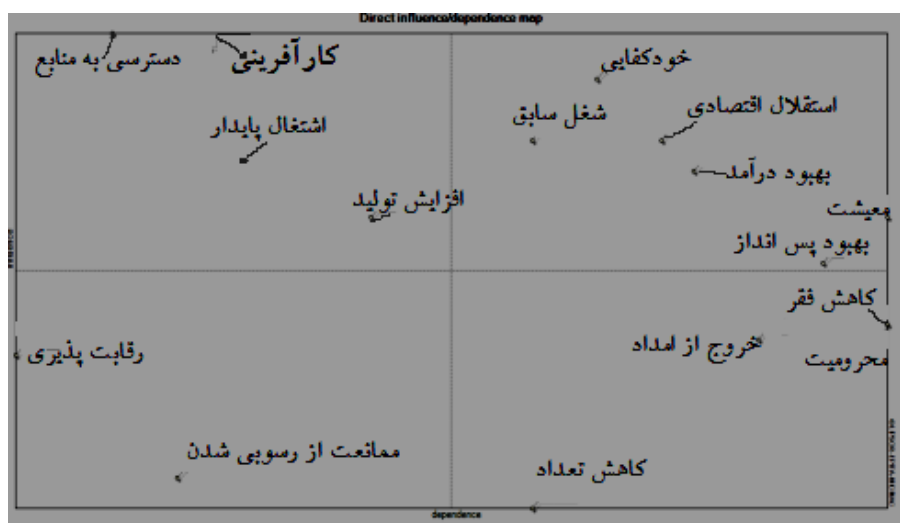
شکل ۱. نمودار تأثیر‌گذاری و تأثیر‌پذیری مستقیم تأثیرات مثبت اقتصادی استراتژی مرسوم توانمندسازی

به‌طور کلی ۲۵ شاخص به‌عنوان عوامل اولیه توسط خبرگان شناسایی شده و در قالب ماتریس‌هایی با ابعاد ۱۶×۱۶ و ۹×۹ نمود یافته‌اند.