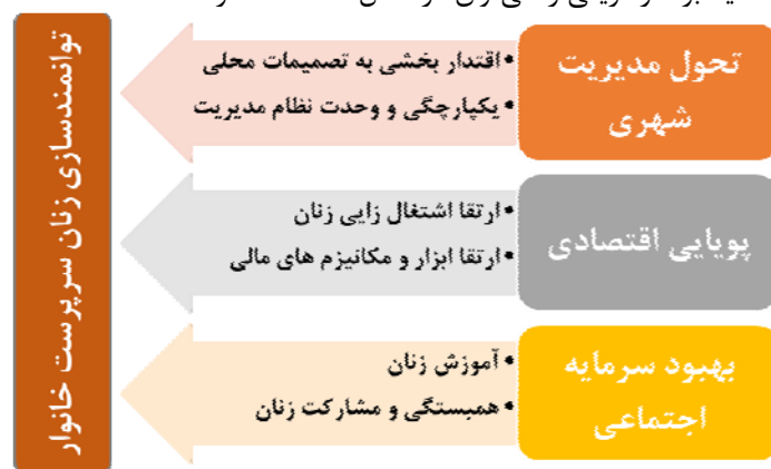
شکل ۱. چارچوب مفهومی توانمندسازی زنان سرپرست خانوار در سکونت‌گاه‌های غیررسمی با تأکید بر کارآفرینی

کسب‌وکارهای خرد به‌عنوان یک استراتژی کاهش فقر استفاده می‌شوند. چالش‌های مختلفی پیش روی زنان سرپرست خانوار جهت ورود و ماندن در عرصه کارآفرینی وجود دارد که از مهم‌ترین آن‌ها دسترسی‌نداشتن به منابع مالی و اعتبارات و فقدان دانش بازار است که با عدم پذیرش اجتماعی و عدم تعادل بین کارهای خانواده و کسب‌وکار مرتبط است (فلاح حقیقی ۱۳۹۴). به‌صورت کلی، عوامل تأثیرگذار در توانمندسازی زنان سرپرست خانوار در سکونت‌گاه‌های غیررسمی با تأکید بر کارآفرینی را می‌توان در شکل ۱ خلاصه کرد: