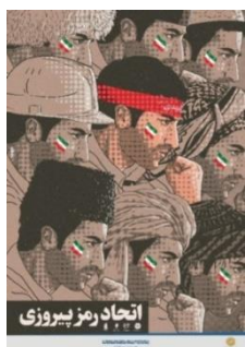
پیروزی، طراحان: ثارالله فرخ، مأخذ:

نشانه‌ها نهادهایی اجتماعی می‌یابند. (Nöth, 1990: 60) درخت سرسبز و زنده به معنای زندگی جاوید و روح فناپذیر و جاودانه است و در اینجا جانشین انقلاب ایران است. رنگ سفید تنه و شاخه‌های درخت نیز به معنای پاکی و رستگاری است. تبر، وسیله‌ای است جهت قطع درختان که دسته آن از جنس درخت است؛ در واقع، بخشی از تبر از جنس چوب است و خود عاملی جهت قطع درختان می‌شود که تداعی کننده مفهوم تضاد است و در انتقال معنای خیانت تأثیرگذار است. همان‌گونه که در تصویر ۳ دیده می‌شود، جمله‌ای کوتاه به زبان انگلیسی بیان شده که معنای فارسی آن «نه به خیانت» است؛ افزون بر آن، سخنی از مقام معظم رهبری جمهوری اسلامی ایران نگاشته شده که بدین شرح است: «دست‌های خیانت‌کار قطع می‌شود و کارایی نظام اسلامی بیشتر و بسیاری از مشکلات فعلی حل خواهد شد».