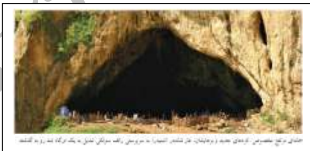
شکل ۱: خانه‌ای مرتفع مخصوص کردهای جدید و بزهایشان. غار شانه در (شانیدر) به سرپرستی رالف سولکی تبدیل به درگاهی شد که رو به گذشته باز شد.

بیشترین مدارک دال بر اینکه دست کم برخی از نئاندرتال‌ها از هم‌نوعان ناتوان خود پرستاری می‌کرده‌اند از شمال عراق به دست آمده است؛ همان‌جا که رودخانه زاب بزرگ در میان دره‌های زاگرس جریان دارد. بالای دیواره شیب‌دار دره شنیدر یک فضای باز وجود دارد که به یک غار بزرگ منتهی می‌شود. در سال ۱۹۵۱ یک باستان‌شناس آمریکایی به نام رالف سولکی ۱ ، منطقه را نقشه‌برداری کرد. او این غار را که هر زمستان به اشغال تعدادی از خانواده‌های بومی گرد و گله‌های آنها درمی‌آمد، به دقت بررسی کرد. هنگامی که سولکی یک گودال کوچک آزمایشی در کف غار کند، شواهدی مبنی بر اینکه از دوران پیش از تاریخ، انسان‌هایی در این غار می‌زیسته‌اند، پیدا کرد. در سال‌های بعد سولکی و یک تیم از دانشگاه کلمبیای نیویورک، همراه با دانشمندان عراقی و کارگران کرد، غار شنیدر را حفاری کردند. آنها در لایه‌های بالایی رسوبات، اجاق‌ها، ابزار و اجساد دفن شده مردمی را پیدا کردند که هر چند در هزاران سال پیش زندگی می‌کرده‌اند، از انسان‌های مدرن به شمار می‌رفتند. سپس در سال ۱۹۵۳ آنها بقایای تنها نئاندرتالی را که تا آن زمان در عراق کشف شده بود پیدا کردند، قطعاتی از اسکلت یک کودک. بعدها معلوم شد که غار شنیدر در بردارنده نه اسکلت نئاندرتال است که عمر آنها بین ۴۰۰۰۰ تا ۷۰۰۰۰ سال تخمین زده می‌شود (Steffoff, 2009: 74-75).