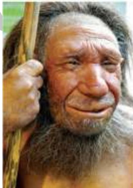
آیا نئاندرتال‌ها در جریان تکامل خود صاحب بینی‌های بزرگ شدند تا بتوانند در هوای سرد عصر یخبندان به آسانی تنفس کنند؟

بسیاری از دیرین‌انسان‌شناسان بر این اندیشه‌اند که فیزیک نئاندرتال‌های قدیمی برای سازگاری با شرایط سرد آب و هوایی اروپا، در طول یخبندان‌های پلیستوسن تکامل پیدا کرد. برخی حتی بر آنند که بینی‌های پهن و بزرگ نئاندرتال‌ها حاصل نوعی سازگاری با سرما بوده است. سوراخ‌های گشاد بینی، ممکن است توانایی آنها را برای گرم کردن هوای سرد، پیش از کشاندن آن به درون ریه‌ها افزایش داده باشد» (Steffoff, 2009: 68-69).