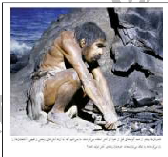
شکل ۴: نئاندرتال‌ها بیشتر از همه گونه‌های قبل از خود از آتش استفاده می‌کرده‌اند. ما نمی‌دانیم که آیا آن‌ها آتش‌های وحشی و طبیعی را رام می‌کرده‌اند یا این که می‌توانسته‌اند خودشان شعله آتش تولید کنند؟

برای در امان ماندن از سرمای استخوان‌سوز، علاوه بر پناه بردن به غارها، تمهیدات دیگری نیز لازم بوده از جمله لباس. «نئاندرتال‌ها همچنین ممکن است چوب را برای سوزاندن بریده یا تراشیده باشند. تحقیقات جدید نشان داده که در سردترین مناطقی که گمان می‌رفته نئاندرتال‌ها در آنجا زیسته باشند، بدن چاق به تنهایی نمی‌توانسته آنها را گرم نگه دارد. نئاندرتال‌ها در شرایط بسیار سخت آب و هوایی توانسته‌اند به کمک منابع تکنیکی و فرهنگی یعنی دانش و ابزار، زنده بمانند. آثار بجا مانده از اجاق‌های درون غارها و استخوان‌های سوخته نشان می‌دهد که آنها از آتش استفاده می‌کرده‌اند. اما آنها به لباس هم نیاز داشته‌اند. آنان احتمالاً پوست و خز حیوانات را تبدیل به لباس و روانداز می‌کرده‌اند. هر چند هیچ نشانی از این چیزها به دست نیامده است و هنوز هم کسی مدرکی نیافته که نشان دهد نئاندرتال‌ها برای خود سرپناه می‌ساخته‌اند (همان: ۸۱-۸۲).