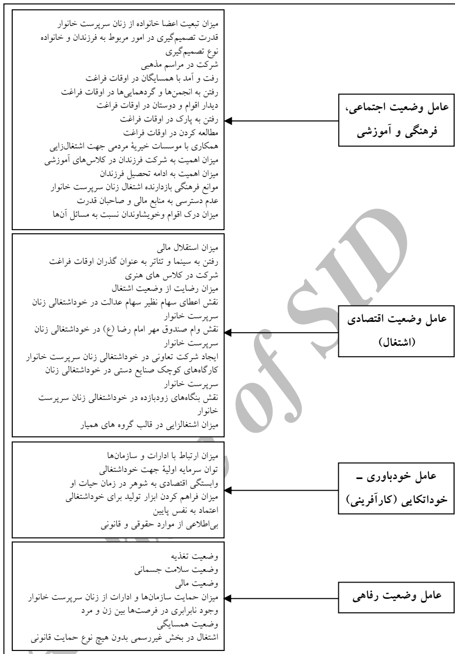
شکل ۲: مدل تجربی عوامل و مولفه‌های موثر بر وضعیت زنان سرپرست خانوار