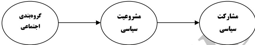
نمودار ۱- مدل نظری پژوهش

و براساس آن مدل تحقیق، به این صورت ترسیم شده است: