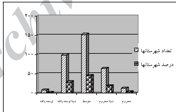
شکل ۱. نمودار تعداد و درصد شهرستان‌های کشور در گروه‌های مختلف توسعه