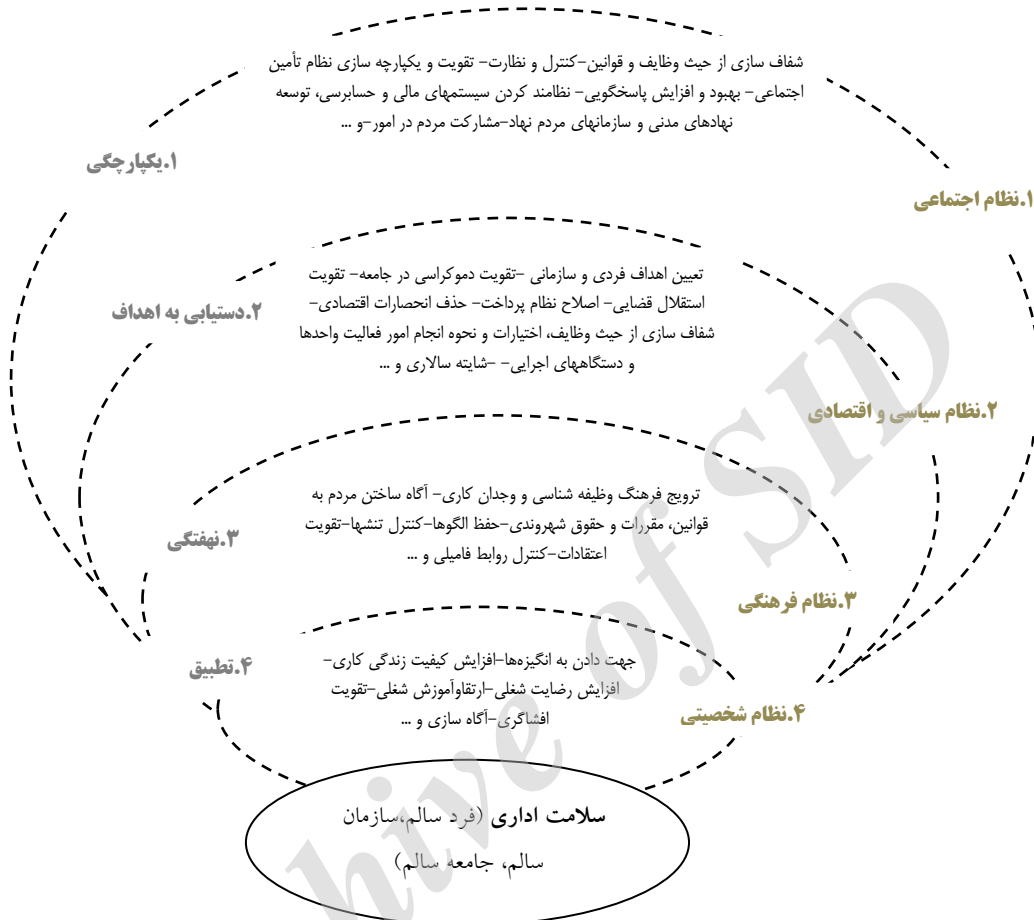
شکل (۲) مدل پیشگیری از فساد اداری با الهام از نظریه کارکردگرایی پارسونز در سیستمهای اجتماعی