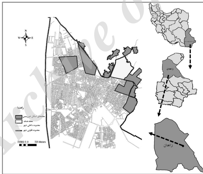
شکل (۲) موقعیت جغرافیایی شهر زاهدان

نزدیکی به افغانستان و وجود تشابهات فرهنگی، به اولین سر منزل آواره‌های افغانستانی تبدیل شد. به تدریج تعداد بیشتری از آواره‌های افغانستانی به دلیل عدم توانایی مالی برای خرید مسکن و یا پرداخت اجاره در داخل شهر، به مناطق حاشیه‌ای روی آوردند. به این ترتیب با گسترش روز افزون آلودگی‌های و کپرنشینی، زمینه‌های ایجاد محله شیرآباد فراهم آمد (نوری، ۱۳۹۲) که ساختار کالبدی آن از دو الگوی روستایی درون شهری (بخش قدیمی شیرآباد) و خانه‌های متعارف اما خودساخته و زیر سطح استاندارد تهیدستان نامتشکل شهری تشکیل شده است (پیران، ۱۳۸۲).