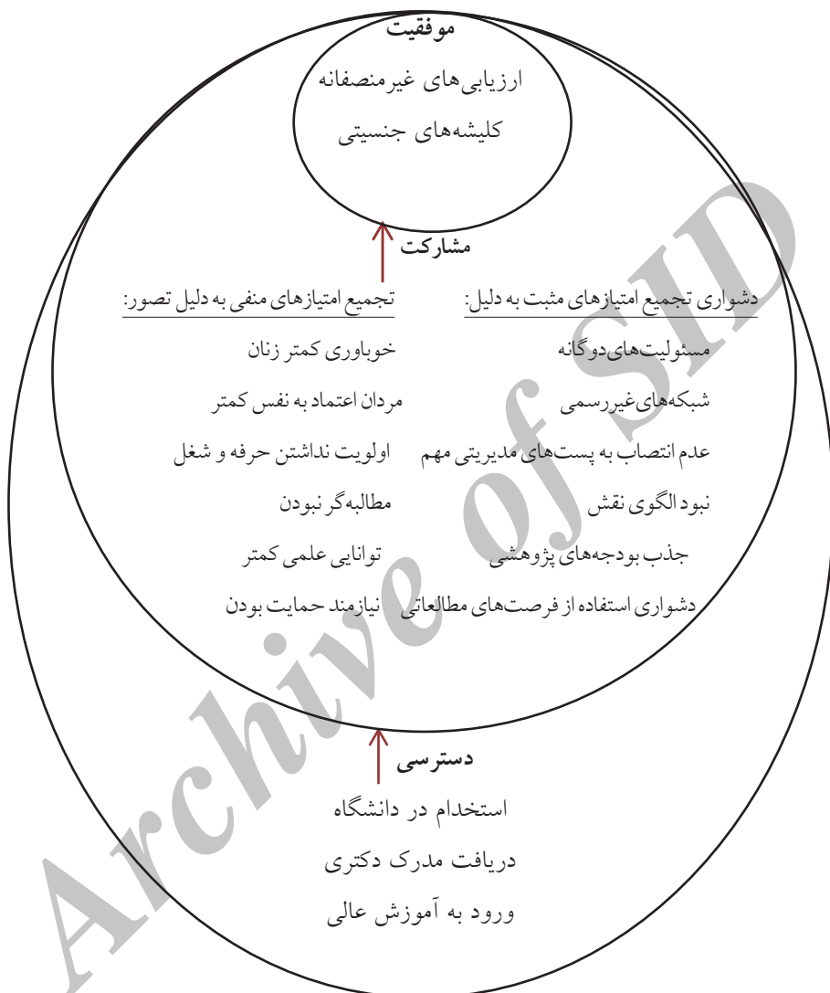
شکل (۳) درجات فراگیری اجتماعی زنان در جامعه دانشگاهی