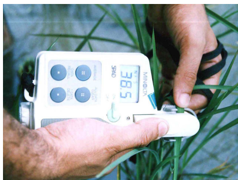
شکل ۱- دستگاه کلوروفیل متر دستی (SPAD-502)

کلوروفیل متر دستی (SPAD-502, Minolta Co. Japan) ۹۰ قرائت انجام شد (Peng et al., 1993, 1995b) انجام گرفت، به طوری که برای هر کرت (شکل ۱).