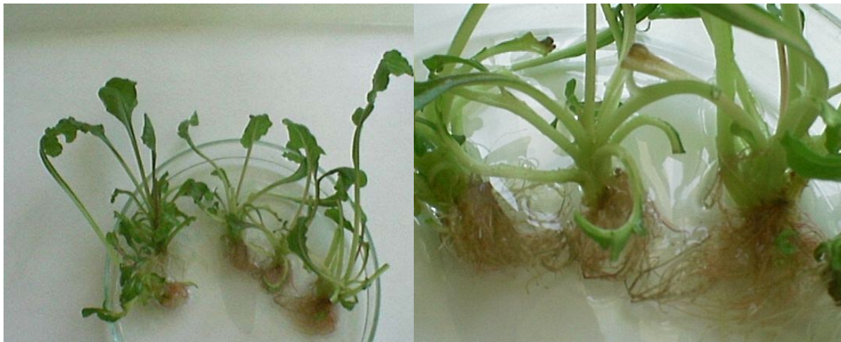
شکل ۳ ریشه‌زایی شاخه‌های چغندر قند در بیوراکتور

نتایج خلاصه شده در جدول ۲ بیان‌گر وجود اختلاف معنی‌دار بین سیستم بیوراکتور و ظروف ۱۰۰ میلی‌لیتری از حیث تمامی فاکتورهای مورد بررسی می‌باشد. علیرغم ریشه‌زایی برخی شاخه‌ها در بیوراکتور (شکل ۳)، نتایج حاصل از اعمال تیمار ریشه‌زایی در