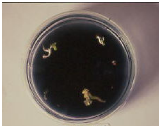
شکل ۶ جوانه‌زنی جنین‌های کشت شده در شرایط درون شیشه

توده‌های نامتمایز سلولی پس از چند روز، قهوه‌ای شده و از بین رفتند. عدم جوانه‌زنی در آزمایش اول به علت بازدارندگی ناشی از ترشح مواد فعلی در کشت جنین هیبرید بود که محدودیت رشد با وجود استفاده از هورمون‌ها در آزمایش دوم نیز برطرف شد. در آزمایش سوم، علاوه بر هورمون‌های BA و NAA به ترتیب به میزان ۰/۲ و ۰/۵ میلی‌گرم در لیتر، هورمون GA3 (غلظت ۱ میلی‌گرم در لیتر) نیز