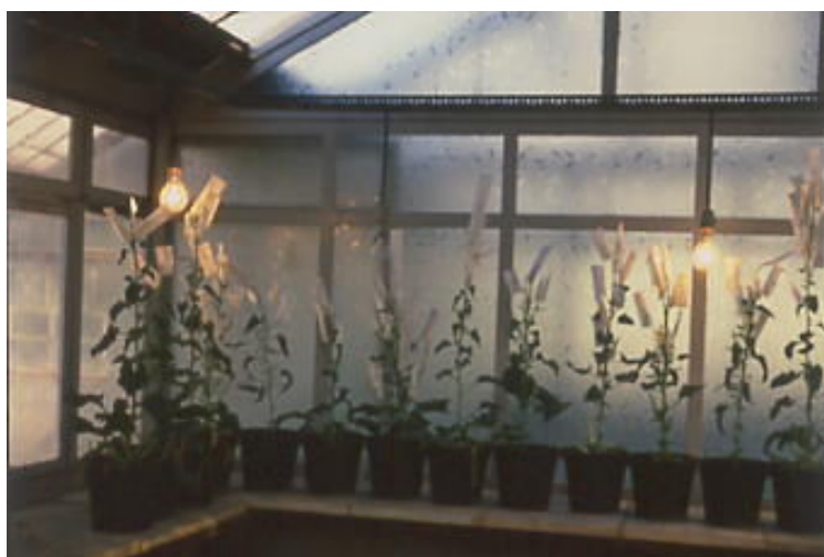
Fig. 2 Pollination of the female plant