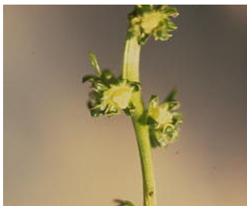
شکل ۴ گل‌های تلقیح شده در والد مادری (۱۴ روز پس از عمل گرده افشانی)

بودن ضریب اطمینان در انجام تلاقی و تهیه دورگ مورد نظر از روش اخته سازی گل‌های نر و گرده افشانی