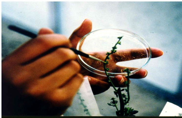
شکل ۲ انتقال گرده به والد مادری