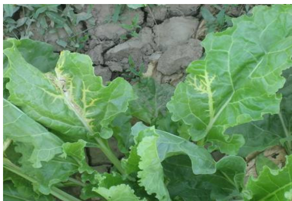
شکل ۱ علائم زردی و نکروز رگبرگ در برگ چغندر قند آلوده به BNYVV

در آزمون عیارسنجی در تمام رقت‌های مورد استفاده، بین آنتی‌بادی و آنتی‌بادی متصل به آنزیم واکنش وجود داشت. به‌طور مثال، میزان جذب نور در کم‌ترین رقت‌های به‌کار رفته آنتی‌بادی و آنتی‌بادی متصل به آنزیم (رقت ۱/۱۵۰۰) با عصاره رقیق شده ریشه آلوده به نسبت یک به پنج و یک به ده، به ترتیب ۰/۳۰۴ و ۰/۱۸۳ بود (جدول ۱). هم‌چنین در این