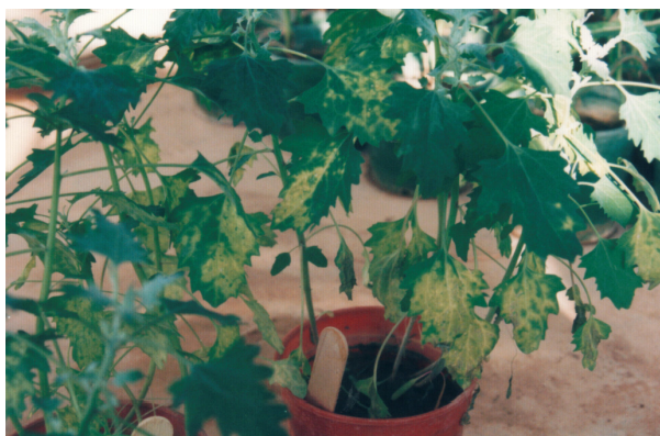
شکل ۲ توسعه لکه‌های موضعی و زردی در رگبرگ‌های C. quinoa ، پس از سپری شدن ۱۴ روز از زمان مایه‌زنی