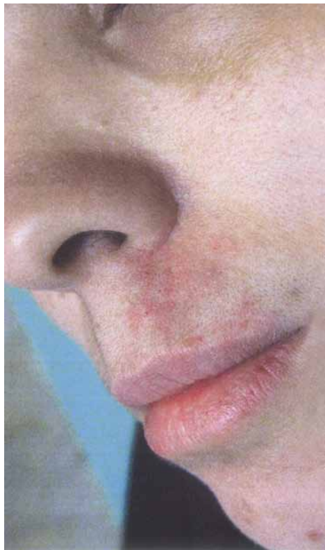
تصویر شماره ۱ - ضایعه port wine stain قبل از درمان با PDL

این گزارش ۲ مورد از ایجاد گرانولوم پیوژنیک شرح داده شد که پس از درمان با لیزر PDL به وجود آمد و