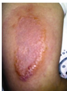
تصویر شماره ۱ - پلاک اریتماتوی وسیع روی بازو همراه با وزیکول‌های سالم در حاشیه ضایعه

بیمار سابقه‌ای ثابت شده از عفونت با فاسیولاهپاتیکا داشت. این عفونت انگلی، بیماری شایعی در استان گیلان است و تنها در سال ۱۹۹۹ میلادی، بیش از ده هزار نفر در این استان با این انگل آلوده شدند (۲۵). فاسیولیزیس ممکن است با علایم مختلف پوستی همراه باشد و یک مورد از همراهی آن با پانیکولیت و سلولیت ائوزینوفیلی قبلاً گزارش شده است (۲۶). در مورد بیمار این مطالعه نیز ممکن است چنین ارتباطی وجود داشته باشد، هر چند فاصله دو ساله، احتمال چنین رابطه‌ای را کم‌تر مطرح می‌کند.