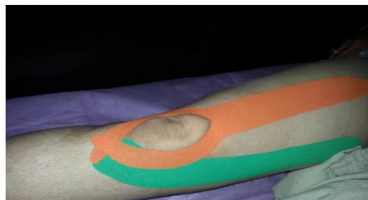
تصویر شماره ۱: نحوه کینزیوتیپینگ زانو

تیپ، از سر ثابت به سر متحرک (Origin to Insertion) این عضله با میزان Tension ۵۰٪ اعمال می شد (تصویر شماره ۱) (۲۵،۲۴).