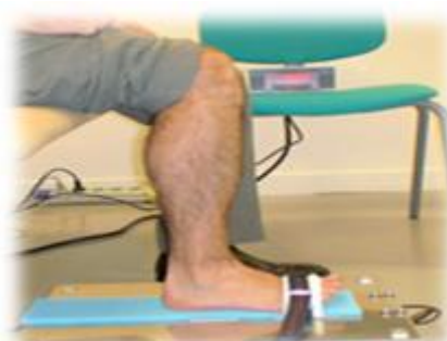
تصویر شماره ۵: اندازه گیری قدرت ایزومتریک دورسی فلکسور میچ پا

اندازه گیری قدرت عضلات دورسی فلکسور میچ پا: قدرت عضلات دورسی فلکسور میچ پا در وضعیت نشسته روی لبه ی تخت در حالی که ساق پای فرد توسط یک استرپ به پایه ی تخت محکم شده است، اندازه گیری شد، همزمان با حرکت میچ پا به سمت بالا، عدد دینامومتر که در ناحیه ی سر متاتارس ها قرار دارد، ثبت شد. این انقباض ۳ بار و در هر بار به مدت ۵ ثانیه حفظ می شد و مدت استراحت بین انقباضات نیز ۱۰ ثانیه در نظر گرفته شد (۴۱).