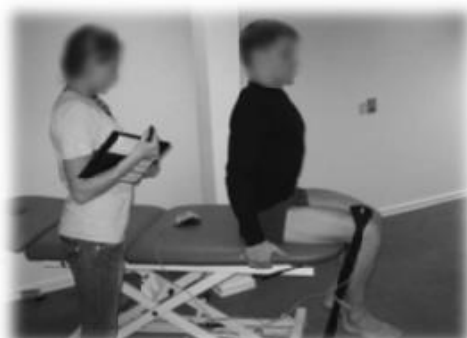
تصویر شماره ۱: اندازه گیری قدرت ایزومتریک

اندازه گیری قدرت عضلانی فلکسورهای ران: قدرت عضلات فلکسور ران در وضعیت نشسته در لبه ی تخت درحالی که فرد با دستانش کناره های تخت را می گرفت، اندازه گیری شد. هم زمان با بلند کردن ران از روی تخت، عدد دینامومتر که در نیمه ی فاصله ی بین لبه ی فوقانی کشکک و خط اینگواینال قرار دارد، ثبت می شد. این انقباض ۳ بار و در هر بار به مدت ۵ ثانیه حفظ می شد و مدت استراحت بین انقباضات نیز ۱۰ ثانیه در نظر گرفته شد (۳۸).