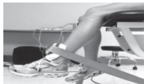
تصویر شماره ۳: اندازه گیری قدرت ایزومتریک اکستنسورهای زانو

اندازه گیری قدرت عضلانی اکستنسورهای زانو: نحوه اندازه گیری قدرت انقباض ایزومتریک عضلات اکستنسور زانو بدین ترتیب بود که بیمار روی صندلی دستگاه طوری می نشست که پشتی صندلی کاملاً منطبق بر پشت فرد بود و مفصل هیپ در ۹۰ درجه فلکشن و زانو در زاویه ۶۰ درجه فلکشن قرار گرفت. سپس صفحه فشار دستگاه دو سانتی متر بالاتر از قوزک داخلی قرار داده شد و از بیمار خواسته شد تا حداکثر نیروی خود را تا جایی که درد نداشته وارد کند. این انقباض ۳ بار و در هر بار به مدت ۵ ثانیه حفظ شد و مدت استراحت بین انقباضات نیز ۱۰ ثانیه در نظر گرفته شد (۴۰).