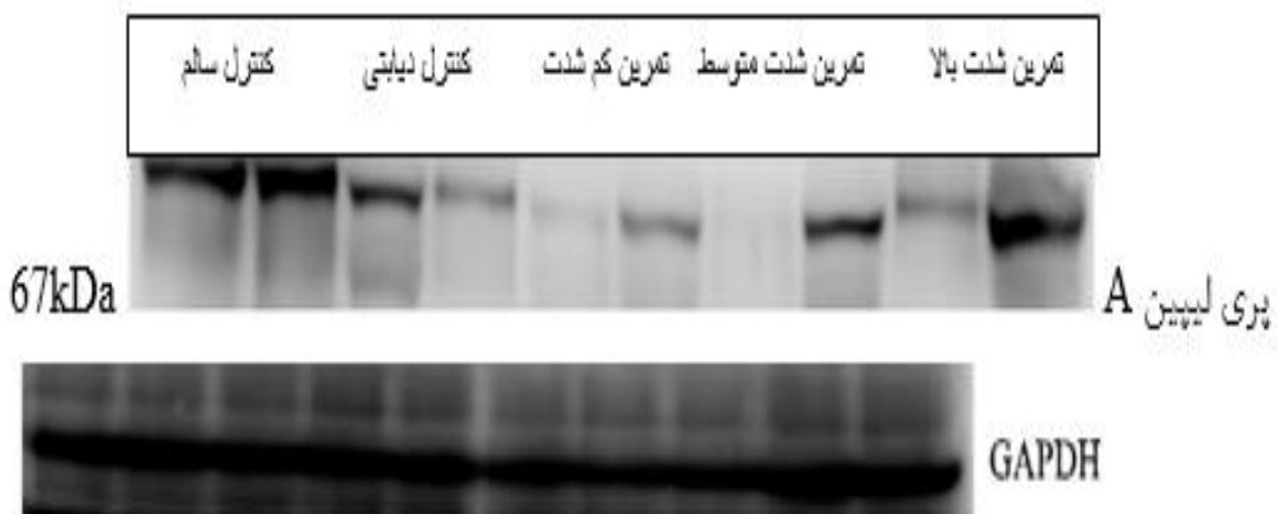
تصویر شماره ۱: چگالی باند پروتئین پری لیپین A در گروه ها