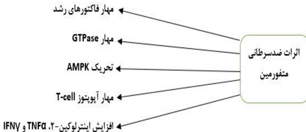
تصویر شماره ۱: مکانیسم های احتمالی متفورمین در بروز اثرات ضد توموری (۴۴)

تغییرات اپی ژنتیکی شامل یکسری از فرآیندهایی از قبیل متیلاسیون، استیلاسیون و حتی فسفریلاسیون بر روی DNA می باشد (۵۰). اختلال مکانیسم های اپی ژنتیکی منجر به پیشرفت غیرطبیعی در ترانسفورماسیون های بدخیم می گردد. تغییرات هیستون می تواند دستیابی فاکتورها و کمپلکس های تنظیمی به کروماتین را تحت تأثیر قرار دهد (۵۱).