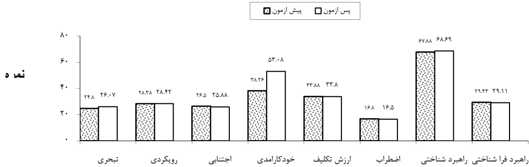
نمودار ۱: مقایسه میانگین نمرات خرده آزمون‌های باورهای انگیزشی و راهبردهای خودتنظیمی قبل و بعد از آموزش در گروه سخنرانی(شاهد) در دانشجویان پرستاری و مامایی دانشگاه علوم پزشکی مشهد

تشکیل داد. که میانگین سنی آنان 21/0 \pm 0/7 سال و میانگین معدل کل 16/0 \pm 0/9 بود. واحدهای پژوهش در دو گروه تجربی و شاهد از نظر سن، معدل کل، جنس، رشته تحصیلی و علاقه به رشته تحصیلی اختلاف معناداری نداشتند و همگن بودند. نمودار ۱ اختلاف میانگین نمرات باورهای انگیزشی و