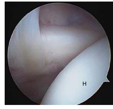
شکل ۳. تاندون ساب اسکاپولاریس در حالت چرخش به داخل

بیمارانی که تنودزیس بایسپس داشتند، چند درجه آخر اکستانسیون محدود گردید. همچنین چرخش خارجی پاسیو با محدودیت تا حد نوترال در ۶ هفته اول بایستی بلافاصله شروع می‌شد. پس از ۶ هفته گردن‌آویز برداشته شده و حرکات کششی در تمام جهات از جمله حرکات بالای سر شانه و چرخش به داخل و خارج آغاز گردید. حرکات ایزوتونیک تا ۱۲ هفته شروع نشد. پس از عمل ترتیب مراجعه بیماران ۲ هفته، یک ماه، ۲ ماه، ۳ ماه بعد و سپس هر سه ماه یکبار در ماه‌های ۶، ۹ و ۱۲ بود که به‌وسیله (۱۴) معیار UCLA مورد ارزیابی قرار گرفتند و میزان بهبودی با میزان قبل از عمل مقایسه شد. تا پایان مطالعه، ۴ بیمار پیگیری ۱۲ ماهه و ۶ بیمار پیگیری ۶ ماهه داشتند.