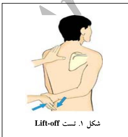
شکل ۱. تست Lift-off

دو تست تشخیصی Lift off و ناپولئون انجام شدند. در تست Lift off از بیمار خواسته شد دست شانه آسیب دیده را در گودی پشت کمر قرار دهد و سعی کند با چرخش شانه به سمت داخل دست را از بدن جدا نماید (شکل ۱). عدم توانایی در انجام تست به‌عنوان مثبت و توانایی انجام تست منفی قلمداد شد (۵،۶) . البته بسیاری از بیماران به‌علت درد همراه قادر به انجام این تست نبودند.