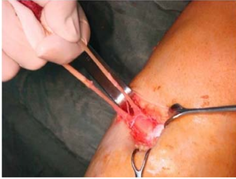
شکل ۲. گرافت برداشته شده با حفظ اتصال به پریوست