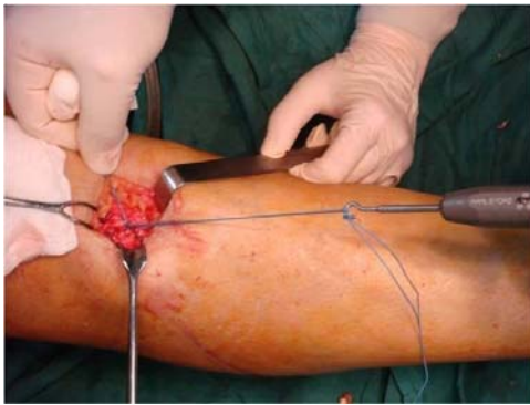
شکل ۴. ثابت کردن نهایی جزء تی بیا گرافت همسترینگ در روش ثابت کردن دوبل