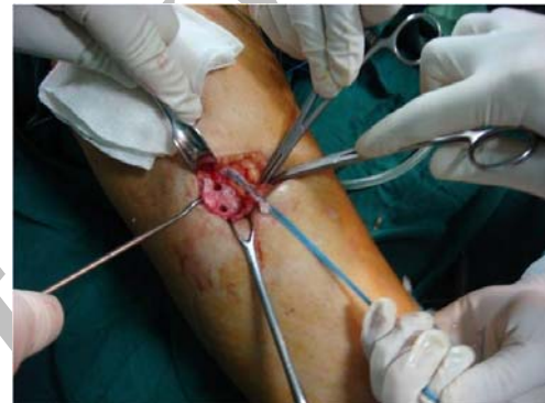
شکل ۳. روش ایجاد کانال در استخوان تی بیا جهت عبور انتهای گرافت در روش ثابت کردن دوبل

تا عمل جراحی در گروه مورد و شاهد تفاوت آماری معنی داری دیده نشد. (به ترتیب 11/4 \pm 6/9 ماه و 14/6 \pm 5/2 ماه، p > 0/05 ). همچنین تعداد جلسات فیزیوتراپی در دو گروه فاقد تفاوت آماری معنی دار بود (به ترتیب 29/3 \pm 11/9 جلسه و 26/25 \pm 8/2 جلسه، p > 0/05 ).