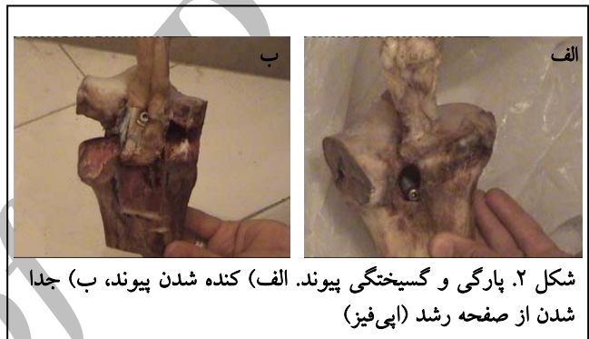
شکل ۲. پارگی و گسیختگی پیوند. الف) کنده شدن پیوند، ب) جدا شدن از صفحه رشد (اپی‌فیز)

از گروه ب گسیختگی به شکل جدا شدن صفحه رشد بود (شکل‌های ۱ و ۲).