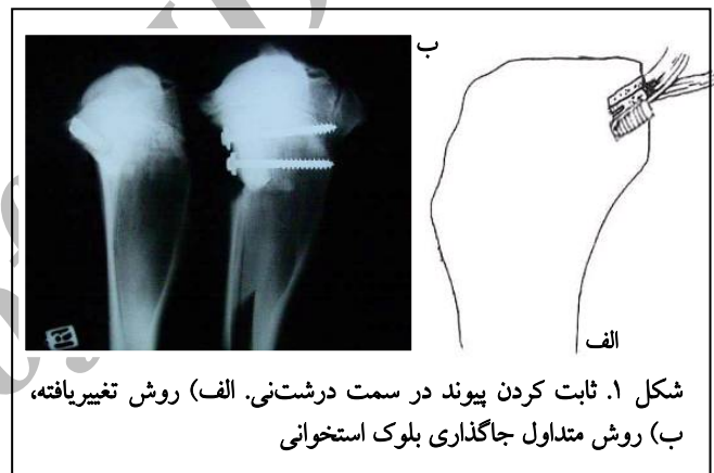
شکل ۱. ثابت کردن پیوند در سمت درشت‌نی. الف) روش تغییر یافته، ب) روش متداول جاگذاری بلوک استخوانی

در گروه الف به روش «جاگذاری در محفظه استخوانی»، بلوک استخوانی در محل با ۲ عدد پیچ ۴/۵ میلی‌متری اسفنجی ۱ و واشرها ثابت گردید (شکل ۱). در این گروه محل قرارگرفتن بلوک استخوانی بر روی درشت‌نی به وسیله استئوتوم و اره ایجاد شد.