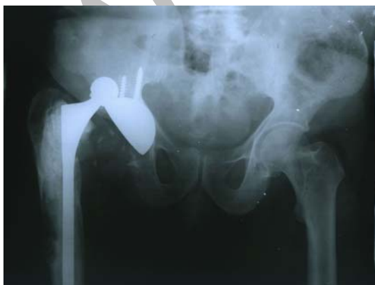
شکل ۲. مرد ۶۲ ساله با دررفتگی مفصل هیپ، ۲ ماه بعد از عمل جراحی با زاویه تمایل ۶۲ درجه