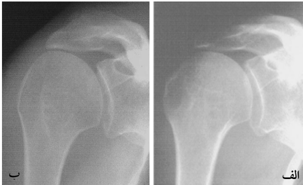
شکل ۳. پرتونگاری روبروی شانه. الف) قبل از عمل، ب) پس از عمل توپروپلاستی

میانگین فاصله آکرومیومورال از ۵ میلی متر قبل از جراحی به ۴ میلی متر پس از جراحی کاهش یافت. علاوه بر ۴ بیماری که قبل از عمل، تغییرات دژنراتیو داشتند و این تغییرات در یکی از آنها به میزان اندکی بیشتر بود، ۲ بیمار دیگر هم پس از جراحی تغییرات مختصر رادیولوژیک نشان دادند. البته تغییرات دژنراتیو ارتباط معنی داری با نتایج عملکردی و بالینی بیماران پس از عمل جراحی نداشت.