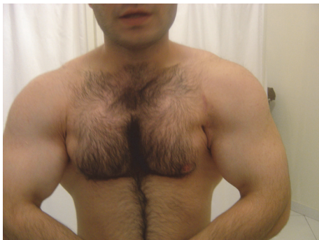
شکل ۲. نمای ظاهری بعد از یک سال در یک بیمار با نتیجه خوب