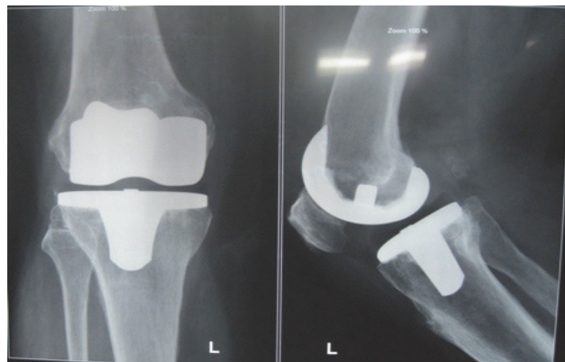
شکل ۱. تعویض مفصل زانو با روش کینماتیک

روش راستای مکانیکی: به روش کلاسیک، با بستن تورنیکت و با ایجاد شکاف پوستی مستقیم مفصل آرتروتومی شده با نصب