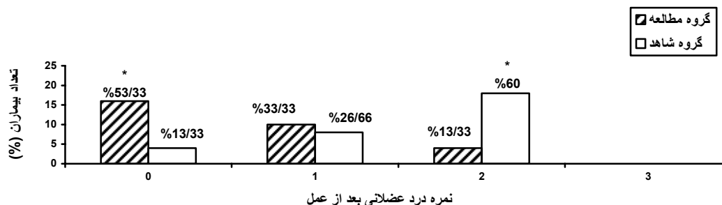
شکل ۲. شیوع و شدت میالژی بعد از عمل در بیماران دو گروه مطالعه p < 0.001