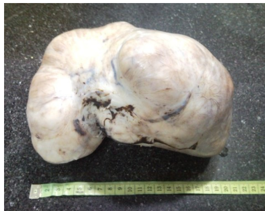
شکل ۳. توده بعد از رزکسیون

در اتاق عمل بعد از پرپ و درپ با انسزیون میدلاین بالا و پایین ناف شکم باز شد. در بررسی داخل شکم، توده بزرگ پایه‌دار که از جسم رحم منشأ گرفته و تمام فضای لگنی را اشغال کرده و تا زیر کبد گسترش داشت مشاهده شد. در بررسی سایر ارگان‌ها از جمله کبد ضایعه‌ای یافت نشد. لنفادنوپاتی پارآئورتیک و مزانتریک و لگنی وجود نداشت. توده مذکور از پایه رزکسیون شد (شکل ۳)، هموستاز کنترل شد و به عمل خاتمه داده شد.