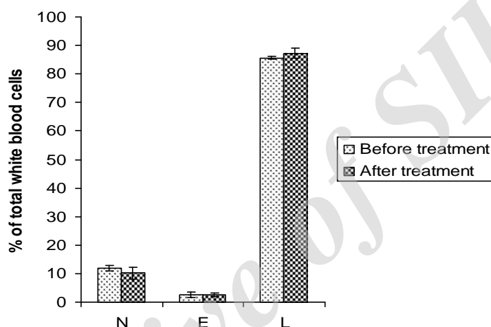
شکل ۲. مقایسه تعداد نوتروفیل ها (N)، p = 0.524 ، آئوزینوفیل ها (E) p = 0.49 ، و لنفوسیت ها (L) p = 0.306 ، در حیوانات درمان شده با متی مازول، قبل و بعد از درمان.

HSV-1: بارگرافها در شکل ۳ (ب) تیترا ویروس را در عصاره طحال حیوانات نشان می دهند. بر این اساس در حیواناتی که متی مازول دریافت کرده و هیپوتیروئید بودند عفونت زائی ویروس حدود ۱۰ برابر بیشتر (۵۰ TCID 50 ۶/۸±/۰۹) از حیوانات گروه کنترل یوتیروئید (۵۰ TCID 50 ۵/۴۰±/۲۱) می باشد. آنالیز آماری نتایج نشان داد که تفاوت مشاهده شده در تیترا ویروس و میزان آلودگی حیوانات از نظر آماری با p < 0.05 معنی داری می باشد.