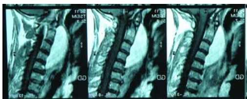
شکل شماره ۲- MRI-Scan در نمای ساجیتال ضایعه ای با High signal intensity در سطح مهره های C2 تا C5 در ناحیه پرورتبرال را نشان داده است.

MRI-Scan بیمار (با و بدون کانتراست) توده ای ۷۵×۵۰ میلیمتری در ناحیه رتروفارنکس را نشان داد که لیپوم را جزء اولین تشخیص های افتراقی قرار داده بود (شکل شماره ۲)