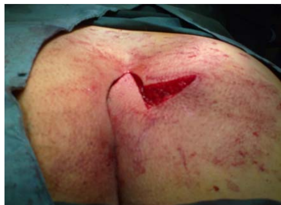
شکل ۳- چرخش فلپ لیمبرگ و پر شدن محل سینوس

علیرغم زمان طولانی‌تر نسبت به سایر روشها، این تکنیک به دلیل عوارض کم زخم، زمان کوتاه بستری و برگشت سریع بیمار به کارهای روزمره، روش مناسبی برای درمان سینوس پیلونیدال پیشنهاد می‌شود.