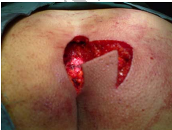
شکل ۲- ایجاد برش لوزی امتداد یافته

مطالعه حذف شدند. بیمار در روز عمل بستری می‌شد و به بیمار توصیه می‌شد صبح روز عمل به حمام رفته و ناحیه بین باسنی shave شود. آنتی‌بیوتیک پروفیلاکسی ۱ گرم سفتریاکسون و ۵۰۰ میلی‌گرم مترونیدازول به بیمار حین عمل داده شد. بیمار بعد از بیهوشی عمومی در حالت prone و در وضعیت jack-knife قرار گرفته، با چسب باسنها را به دو طرف کشیده محل عمل را مشخص نموده و انجام جراحی به روش زیر انجام شد: