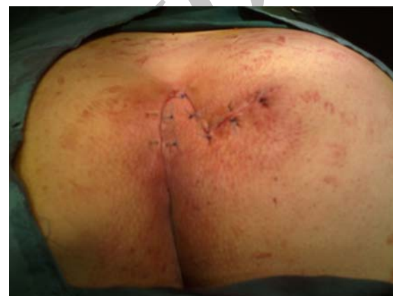
شکل ۴- ترمیم برش لوزی و فلپ لیمبرگ