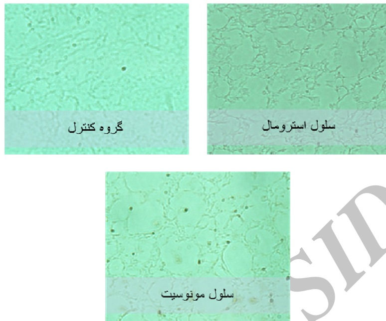
شکل ۱: مقاطع عرضی نخاع گروه کنترل، سلول استرومایی و سلول مونوسیت). نقاط سیاه در هر مقطع نشان دهنده‌ی آکسون نورون‌های رنگ آمیزی شده است. این نقاط شمارش شده است.