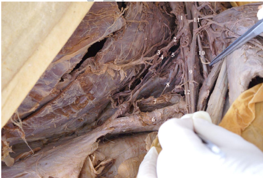
شکل ۲- تشریح حفره آگزیلاری طرف چپ: ۱- شریان آگزیلاری، ۲- تنه مشترک Lateral thoracic-thoracodorsal ، ۳- شریان سینه‌ای خارجی، ۴- شریان توراکودورسال، ۵- عصب توراکودورسال ۶- عضله پهن پشتی، ۷- عضله گرد بزرگ، ۸- عصب تحت کتفی تحتانی، ۹- عصب مدیان، ۱۰- عصب جلدی عضلانی، ۱۱- شاخه دلتوئید شریان توراکوآکرومیال و ۱۲- عصب اولنار