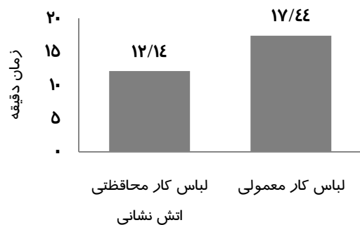
نمودار ۲) مقایسه زمان انجام فعالیت بدنی در لباس کار و لباس محافظتی آتش نشانی