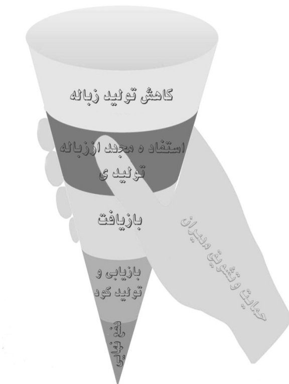
شکل ۱) هرم مدیریتی پسماندها با رویکرد کاهش تولید و بازیافت

امروزه هرم مدیریت پسماندها بر اساس شکل ۱ است. همان‌طور که مشاهده می‌شود، در ابتدا و اولویت اول کاهش تولید پسماند با بیشترین سطح پوششی نمودار، قرار دارد و امروزه پیشگیری از تولید پسماند در سطح جهان به شدت مورد توجه است و الگوی موفق و قابل‌اجرای حتی در بیمارستان‌ها، ادارها و سازمان‌ها، صنایع و کارخانه‌ها و حتی در سطح شهرها است. این امر فقط با اصلاح الگوی مصرف مواد و تجهیزات و وسایل مورد نیاز در بیمارستان میسر خواهد شد. بعد از کاهش تولید پسماندها، به ترتیب جداسازی و تفکیک و استفاده مجدد از پسماندها، بازیافت و تهیه کود از پسماندها و اقدامات پیش تصفیه به‌منظور بی‌خطر سازی و در نهایت دفع هرآن‌چه که به‌عنوان پسماند و دورریز نهایی باقی مانده است، در اولویت قرار دارند [۱۴، ۱۳، ۱۰].