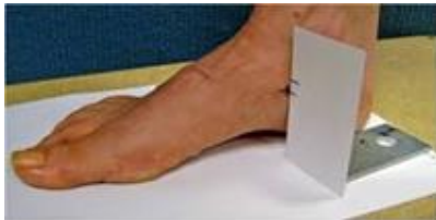
شکل ۱. روش اندازه‌گیری افت استخوان ناوی

استخوان ناوی تا سطح جعبه در واحد میلی‌متر اندازه‌گیری گردید. سپس از آزمودنی خواسته می‌شد که در حالت ایستاده به گونه‌ای که وزن به طور مساوی روی هر دو پای آزمودنی قرار گیرد. در این حالت نیز فاصله برجستگی استخوان ناوی تا سطح جعبه اندازه‌گیری و ثبت شد. آزمونگر فاصله برجستگی استخوان ناوی تا سطح جعبه را در حالت تحمل وزن (ایستاده) از میزان فاصله استخوان ناوی تا سطح جعبه در حالت بدون تحمل وزن (نشسته روی صندلی) کسر کرد. عدد بدست آمده میزان افتادگی استخوان ناوی را نشان می‌داد. اندازه‌گیری میزان افت استخوان ناوی در هر آزمودنی سه بار انجام شد و از میانگین آنها به منظور طبقه‌بندی افراد در دو گروه استفاده شد. اگر میزان افت استخوان ناوی آزمودنی بین ۵ تا ۹ میلی‌متر بود در گروه پای سالم و بیشتر از ۱۰ میلی‌متر در گروه پرونیشن افزایش یافته قرار می‌گرفت [۲۴، ۲۵].