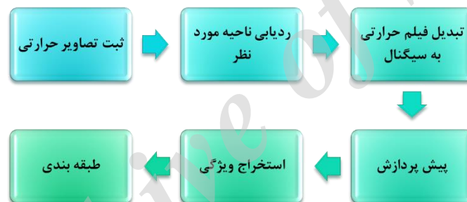
شکل-۱. بلوک دیاگرام پردازش تصاویر حرارتی

در این بخش، روش پردازش تصاویر ویدئویی ثبت شده به منظور تشخیص سوال هدف شرح داده خواهد شد. بلوک دیاگرام الگوریتم پردازشی تصاویر حرارتی در شکل ۱- آورده شده است. به صورت کلی بعد از ثبت تصاویر حرارتی، نواحی از چهره که به منظور پردازش مورد بررسی قرار خواهد گرفت، انتخاب شده و سپس این نواحی در کل تصویر ویدئویی مورد ردیابی قرار خواهد گرفت. در مرحله بعد، از این نواحی سیگنال دمایی استخراج می شود. این سیگنال به صورت بیشترین، کمترین و میانگین دمای نواحی مورد ردیابی است. بعد از استخراج سیگنال دما و انجام پیش پردازش، استخراج ویژگی انجام می شود. در نهایت ویژگی ها بعد از نرمال سازی و کاهش بعد به ورودی طبقه بند داده می شوند و خروجی، برچسبی معادل با استرسی بودن یا غیر استرسی بودن سیگنال را خواهد داد. در ادامه هر کدام از مراحل به تفصیل شرح داده خواهد شد.