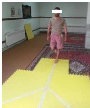
شکل-۲. نحوه اجرای آزمون سه جهش تک پا

از منحنی مشخصه عملکرد سیستم ROC برای تعیین نقطه برش آزمون تعادل Y و آزمون سه جهش تک پا جهت تشخیص سربازان آسیب دیده و آسیب ندیده استفاده شد.