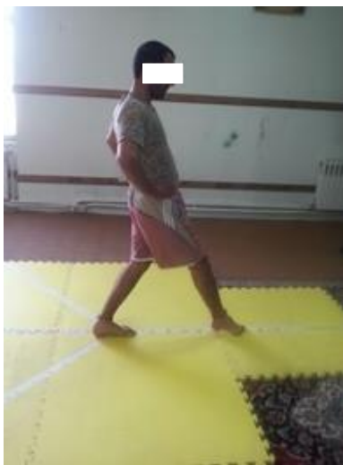
شکل-۱. آزمودنی حین اجرای آزمون Y

بین آزمون گر برای نمره کل به ترتیب ۰/۹۱ و ۰/۹۹ توسط Plisky گزارش شده است (۲۱). در این آزمون سه جهت (قدامی، خلفی-داخلی و خلفی-خارجی) به صورت Y و با زوایای ۱۳۵، ۱۳۵ و ۹۰ درجه نسبت به هم قرار می گیرند. بمنظور به حداقل رساندن اثرات یادگیری هر آزمودنی ۶ بار آزمون را در جهت های سه گانه تمرین می کند تا روش اجرای آن را فرا گیرد (آزمودنی با پای برتر راست آزمون را در خلاف جهت عقربه های ساعت انجام می دهد و آزمودنی با پای برتر چپ آزمون را در جهت عقربه های ساعت انجام می دهد). برای اجرای آزمون، آزمودنی با پای برتر در مرکز جهات می ایستاد و با پای دیگر عمل دستیابی را تا آنجا که خطا نکند (پا از مرکز جهات حرکت نکند، روی پای که عمل دستیابی را انجام می دهد تکیه نکند یا آزمودنی نیفتد) انجام می داد و سپس به حالت طبیعی روی دو پا برمی گشت (شکل-۱). فاصله محل تماس تا مرکز، فاصله دست یابی است. آزمودنی سه بار آزمون را انجام می داد و آزمون گر میانگین دست یابی در هر یک از جهات را اندازه گیری کرده و بر طول پا (بر حسب سانتی متر) تقسیم و در ۱۰۰ ضرب می کرد تا فاصله دست یابی بر حسب درصد اندازه طول پا در هر یک از سه جهت به دست آید. از جمع اعداد به دست آمده و تقسیم آن به عدد سه امتیاز ترکیبی آزمودنی محاسبه شد (۲۱).