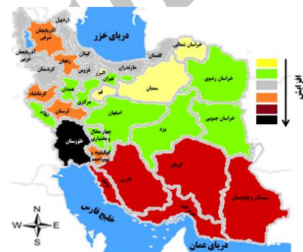
شکل-۲. نقشه فراوانی عقرب زدگی در ایران

به هر حال در برخی مواقع اردوگاههای دائمی و پادگانهای نظامی و یا اردوگاههای موقت در رزمایشها و بحرانها بدون توجه و یا اطلاع از زیستگاههای طبیعی موجودات خطرناک ساخته می‌شود و البته در مواردی هم این امر اجتناب ناپذیر است. در این گونه مواقع بررسی اقدامات کنترلی در حین استقرار نیروها و یا بلافاصله پس از آن برای ممانعت از گزیدگی بایستی صورت گیرد.